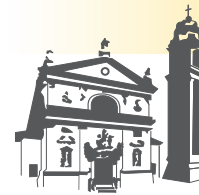
San Giovanni Battista Ospedaletto Euganeo