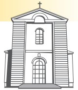
Santa Croce Ospedaletto Euganeo