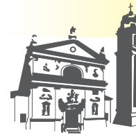
San Giovanni Battista Ospedaletto Euganeo