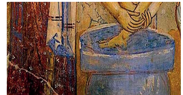
Ignoto, Ciclo pittorico dal Nuovo Testamento (particolare) , affresco, XI sec., Abbazia Sant'Angelo in Formis a Capua

Gli altri dieci, avendo sentito, cominciarono a indignarsi con Giacomo e Giovanni. Allora Gesù li chiamò a sé e disse loro: «Voi sapete che coloro i quali sono considerati i governanti delle nazioni dominano su di esse e i loro capi le opprimono. Tra voi però non è così; ma chi vuole diventare grande tra voi sarà vostro servitore, e chi vuole essere il primo tra voi sarà schiavo di tutti. Anche il Figlio dell'uomo infatti non è venuto per farsi servire, ma per servire e dare la propria vita in riscatto per molti».