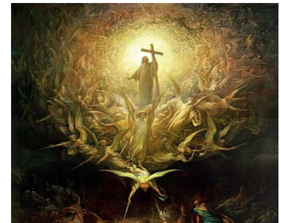
Gustave Doré, Il trionfo della cristianità sul paganesimo , 1868? Olio su tela, Art Gallery of Hamilton. Ontario

In quel tempo, Gesù disse ai suoi discepoli: «In quei giorni, dopo quella tribolazione, il sole si oscurerà, la luna non darà più la sua luce, le stelle cadranno dal cielo e le potenze che sono nei cieli saranno sconvolte. Allora vedranno il Figlio dell'uomo venire sulle nubi con grande potenza e gloria. Egli manderà gli angeli e radunerà i suoi eletti dai quattro venti, dall'estremità della terra fino all'estremità del cielo. Dalla pianta di fico imparate la parabola: quando ormai il suo ramo diventa tenero e spuntano le foglie, sapete che l'estate è vicina. Così anche voi: quando vedrete accadere queste cose, sappiate che egli è vicino, è alle porte. In verità io vi dico: non passerà questa generazione prima che tutto questo avvenga. Il cielo e la terra passeranno, ma le mie parole non passeranno. Quanto però a quel giorno o a quell'ora, nessuno lo sa, né gli angeli nel cielo né il Figlio, eccetto il Padre».