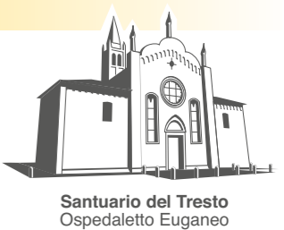
Santuario del Tresto Ospedaletto Euganeo