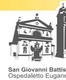
San Giovanni Battista Ospedaletto Euganeo