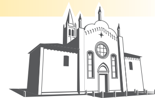
Santuario del Tresto Ospedaletto Euganeo