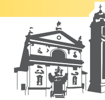
San Giovanni Battista Ospedaletto Euganeo