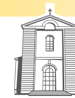
Santa Croce Ospedaletto Euganeo